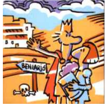
L'agraït rei d' Aragó li atorgà Beniarjó.