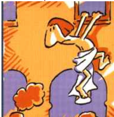
Em aquests anys de joventut a més d'un deixa banyut.