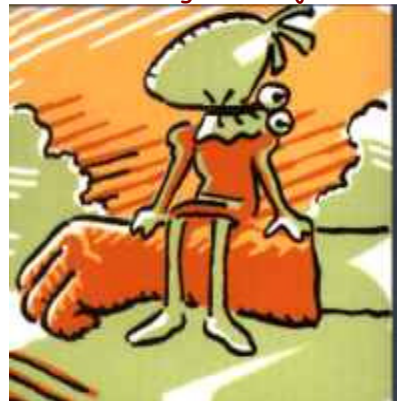
És el falconer del rei, a qui presta el seu servei.