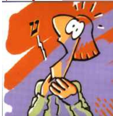
ens relata amb el seu cant el neguit, viu i angoixant