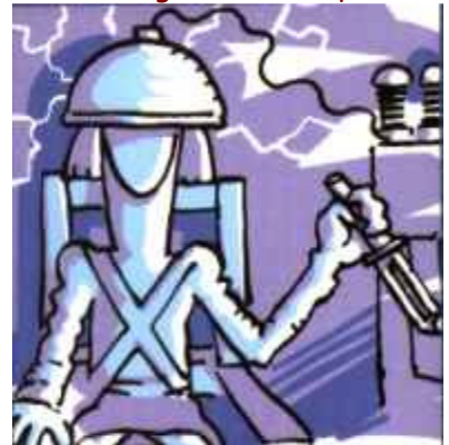
de la carn i el pensament per equilibrar la ment.