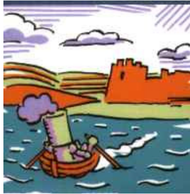
Deixa Nàpols, i a Gandia ve a cercar la poesia