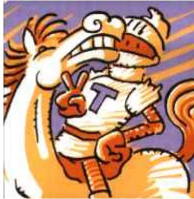
del famós Tirant Lo Blanc, cavaller valent i franc.