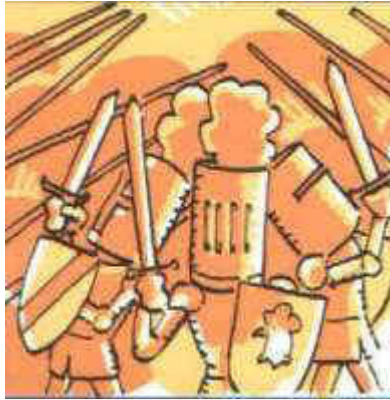
Febrer, ploma vigatana, i el marquès de Santillana