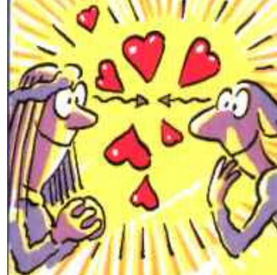
Ja madur, cap als quaranta, una dona me l'encanta.