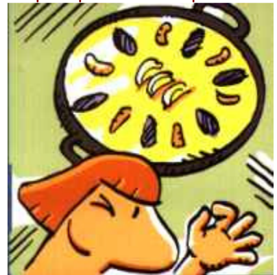
Se'ns en va a viure a València on hi ha gent amb eloqüència,