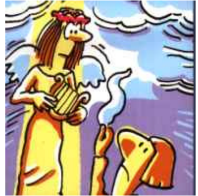
Mes, pobreta, la Isabel prompte se'n va cap al cel.