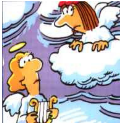
Mes tampoc va tenir sort; pots llegir-ho a Cants de mort .